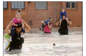
Evacuación en Almoradía.

La gota fría se cobra cinco vidas y deja 3.500 evacuados en el sureste / P. 28-29