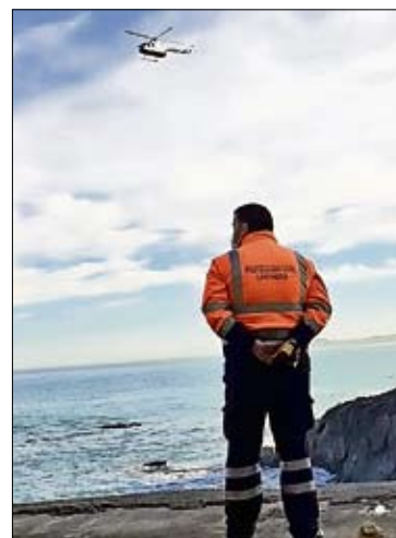
Labores de búsqueda. / ALERTA

La gran distribución ve «poco sentido comercial» a la apertura del día 22 / P. 23