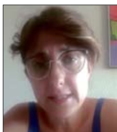
MAR, DE SANT SADURNÍ D'ANOIA, BARCELONA