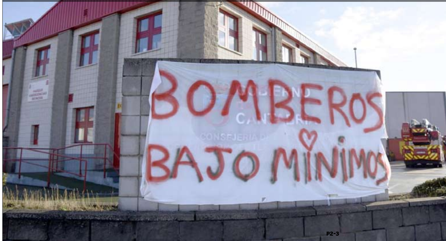
Pancarta colocada por los Bomberos en el Parque de Reinos en protesta por la precariedad laboral que atraviesan ante la falta de personal y material adecuado para poder cumplir con el servicio.

BOMBEROS DE REINOSA Y CASTRO URDIALES PROTESTAN POR LA FALTA DE PERSONAL E INFRAESTRUCTURAS Y DESDE EL SEMCA RECLAMAN AL GOBIERNO QUE CUMPLA LOS ACUERDOS Y TACHAN DE «IRRISORIOS» LOS PRESUPUESTOS DE 2023 PARA LOS SERVICIOS DE EMERGENCIA P2-3