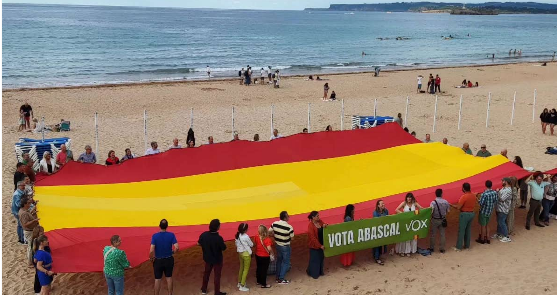
Simpatizantes y candidatos de Vox por Cantabria en las elecciones generales despliegan la bandera gigante de España en la primera playa de El Sardinero.